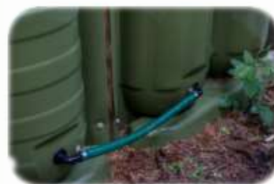
Les autres éléments entre eux.