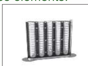
Placement de l'élément