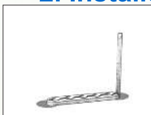
Placement du socle