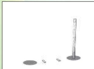
Pose et scellement du 1er poteau