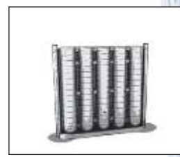
Pose et scellement du 2 ème poteau.